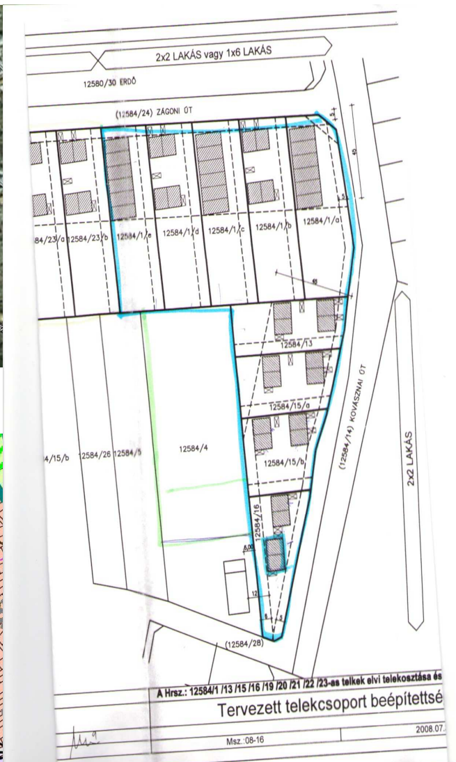
3. ábra Telekalakítási vázrajz